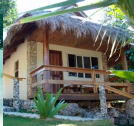
Sopra, un Cottage Superior sotto, il patio di una Cottage Deluxe