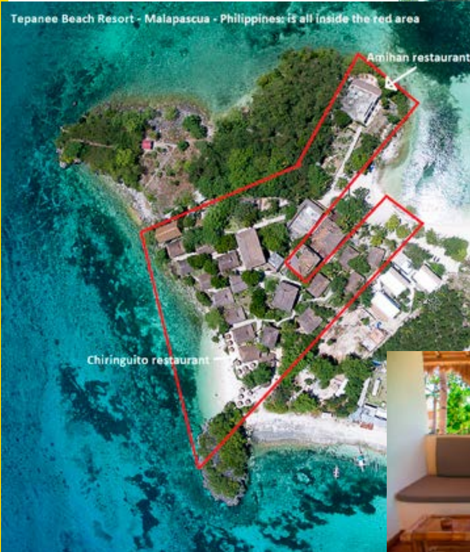
Vista dall'alto del Tepanee Resort. Indicati i ristoranti Amihan e Chiringuito