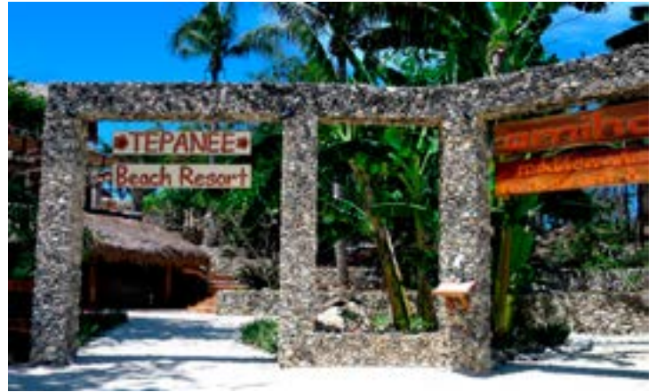
Sopra, l'ingresso del Tepanee Resort; a fianco il ristorante che si affaccia sul lato dell'isola