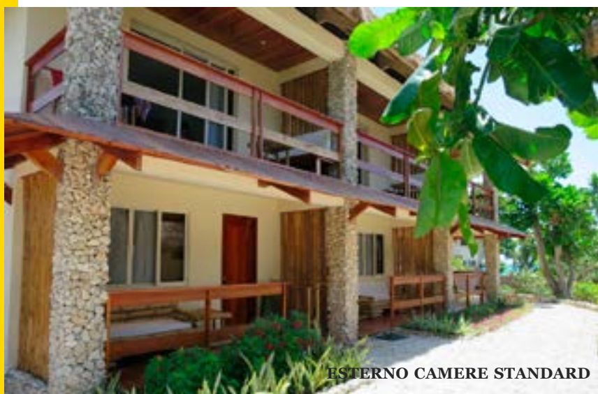
ESTERNO CAMERE STANDARD