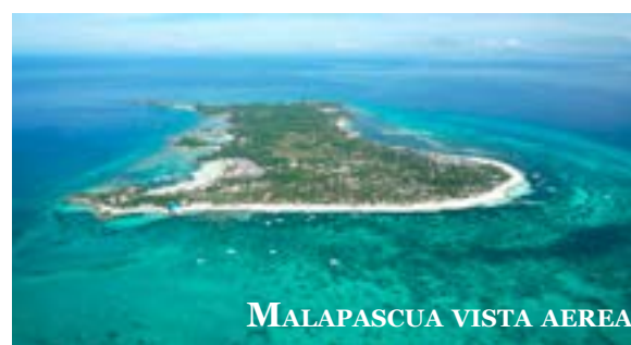
MALAPASCUA VISTA AEREA

Nella collina adiacente alla reception sorge il ristorante panoramico Amihan. Al centro del resort si trovano una piccola palestra, una vasca idromassaggio da 8 posti e la Spa per massaggi rilassanti e trattamenti estetici. Il Wifi gratuito copre tutta l'area del resort, spiaggia inclusa.